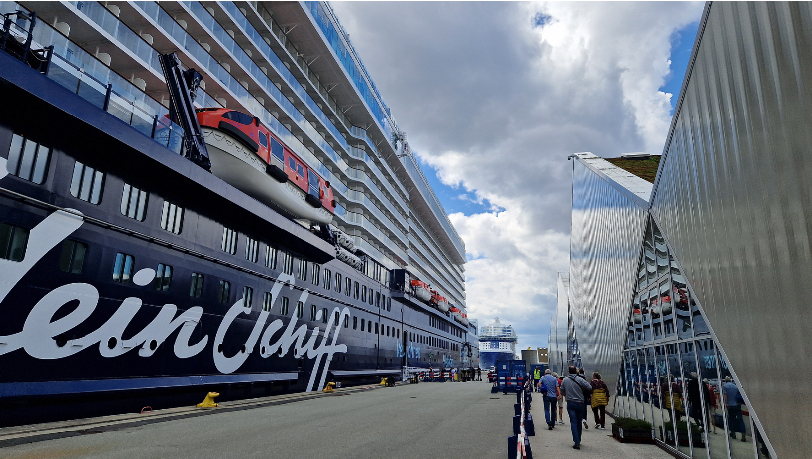
Oceankaj i Köpenhamn.