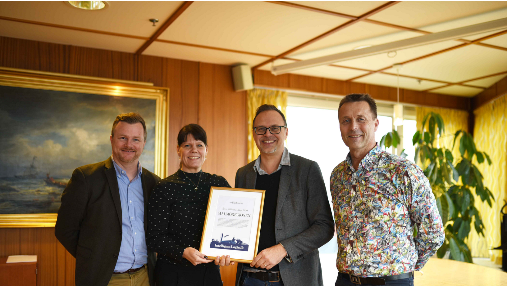
Hamnen i Malmö